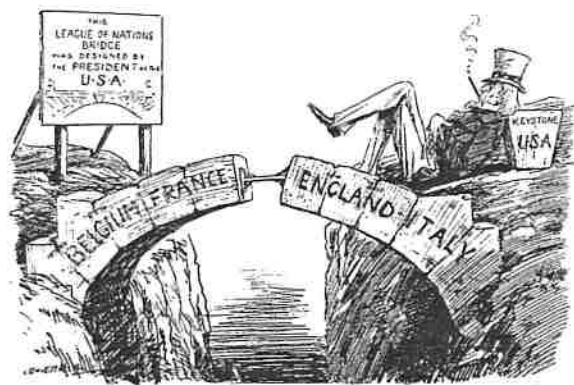
THE GAP IN THE BRIDGE.

解析：這幅漫畫將國際聯盟比喻為橋，但設計橋的美國未加入國聯，甚至無視於橋有縫隙存在，這是對美國未能拉抬國聯聲勢而使國聯處於無用之地的諷刺。