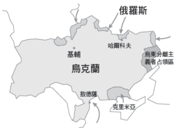
俄羅斯入侵烏克蘭首日路線及地區

從文中可看出俄烏戰爭的遠因中，是由於長期以來部分東烏克蘭人，認同自己為俄羅斯的一員，請問造成此種國家認同分歧的因素為何，並摘錄相關資料佐證。